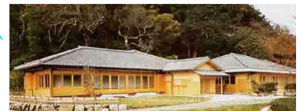
島津家別邸「磯庭園」の中にある本格的な純和風数奇屋建築です。