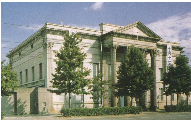
長野宇平治の設計による古代ギリシャ様式建築物。当社の創業受注第一号となった作品です。