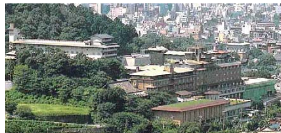
当ホテルは東山連峰の一つである華頂山を背にした趣きのある高級ホテルです。

1925年竣工 作品累計 43 京都市 ■都ホテル(本館棟:写真中央) 片岡建築事務所