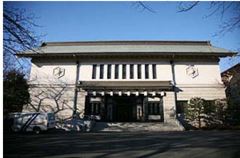
外観は城門を思わせる和風建築で、現在、1階は無料休憩所と図書館に、2階は会議室に使用されています。