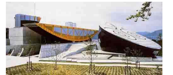
東経135度北緯35度「日本のへそ公園」内にある地球・宇宙をテーマにした科学館です。

1992年竣工 作品累計 7472 西脇市 ■にしわき経緯度地球科学館 毛綱毅曠建築事務所