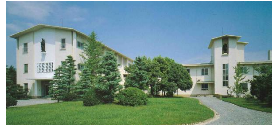
当社設計施工の建物は恵まれた環境の中で今も優美な姿を見せています。

1956年竣工 作品累計 1016 宝塚市 ■幼きイエズス修道会本部 藤木工務店