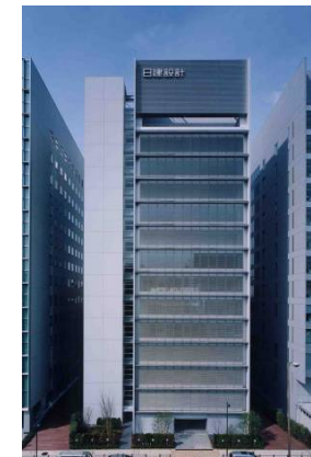
外付け電動ブラインド・ソックダクト他、様々なハイテク諸施設を備えた最先端技術と優れた建築意匠の結晶です。