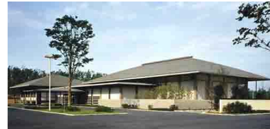
大阪万博開催に合わせ、各国からのVIPをもてなすための迎賓館として建築。昭和天皇もご利用になりました。

1969年竣工 作品累計 2502 吹田市 ■日本万国博覧会迎賓館 彦谷建築設計事務所