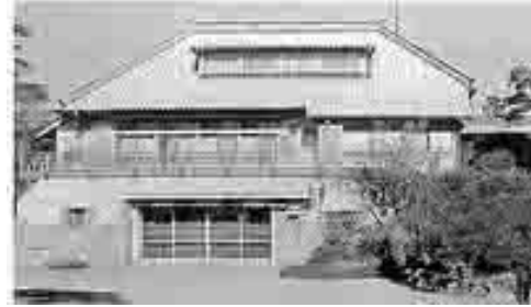
発注者の鮎川義介氏は貴族院議員で日産自動車の創業者様です。