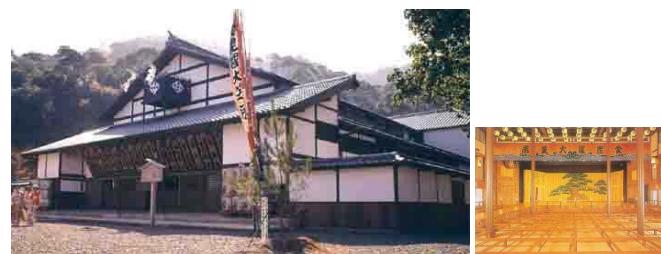
天保年間創建で一時廃屋となりましたが、移築復元工事で、金刀比羅宮近くに建つ現存する最古の劇場です。

1976年竣工 作品累計 3650 香川県琴平町 ■重要文化財 旧金毘羅大芝居 文化財建造物保存技術協会