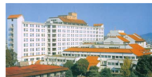
1926年竣工から1938年以降増築を重ね1975年第1棟竣工。2005年第9棟(心臓病センター)竣工。

1975年竣工 作品累計 3484 倉敷市 ■倉敷中央病院 第1棟(写真正面) 浦辺設計